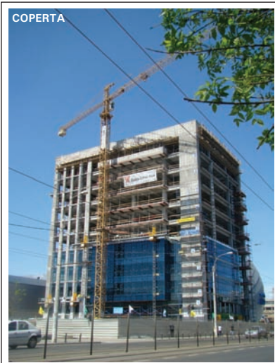
Prima din cele cinci clădiri de birouri ale AFI Cotroceni Business Park (foto la final aprilie 2012)