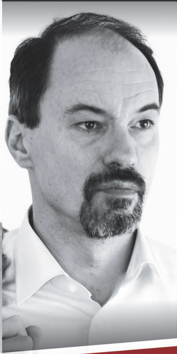
Arh. Șerban ȚIGĂNAȘ Președintele Ordinului Arhitecților din România