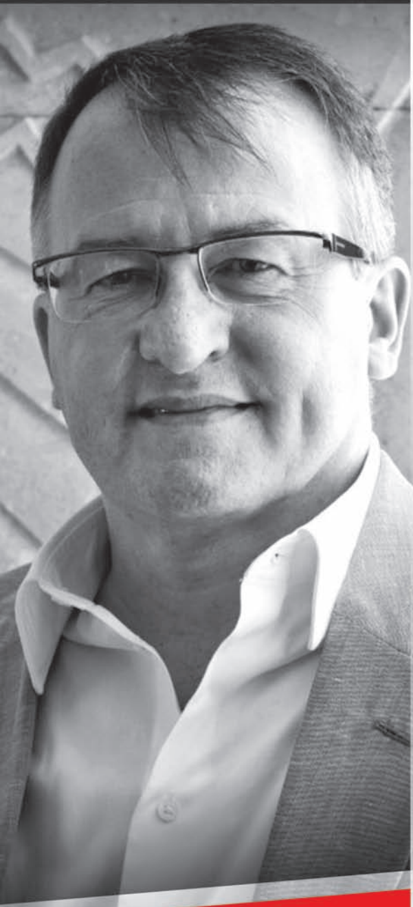
Arh. Stephen HODDER Președintele Royal Institute of British Architects