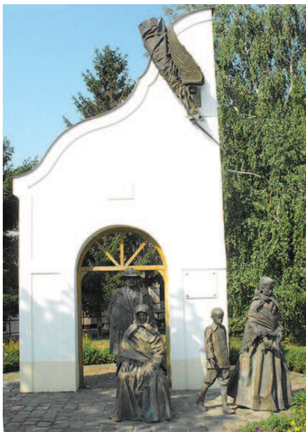
Monument în localitatea Elek

„Ne-am adaptat contextului și am demarat o activitate susținută pentru întocmirea și depunerea de proiecte pentru atragerea de