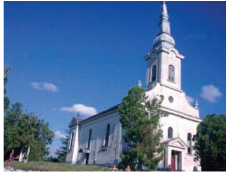
Comuna Grăniceri, județul Arad