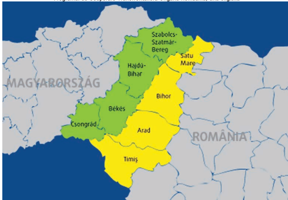
Programul de Cooperare Transfrontalieră Ungaria-România, aria eligibilă

Investiția a presupus realizarea unei legături rutiere între localitatea ungurească Dombegyház și localitatea românească Variașu Mic.