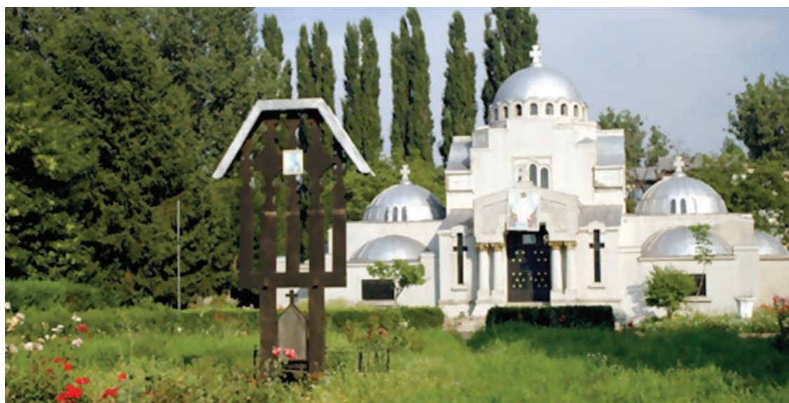
Mausoleul eroilor din Focșani

În acest an vor fi continuate totodată lucrările la Biblioteca Județeană "Duiliu Zamfirescu".