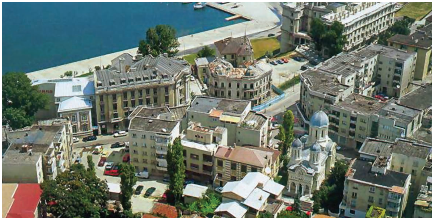
Portul Tomis, Constanța

Suma alocată pentru investiții în acest an de către Primăria Constanța este de 158,99 milioane lei. Principalele surse de finanțare sunt: bugetul local care va contribui cu 92,18 milioane lei la proiectele de investiții, finanțările externe nerambursabile ce vor însuma 59,3 milioane lei și transferurile de la bugetele locale în sumă de 5,64 milioane lei.