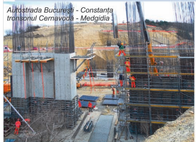
Autostrada București - Constanța tronsonul Cernavodă - Medgidia

Mai multe informații pe www.harsco-i.ro .