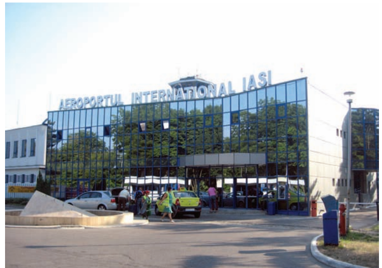
Aeroportul Internațional Iași

➤ contract de servicii de asistență tehnică de management pentru acordarea de sprijin în gestionarea și implementarea „Sistemului de management integrat al deșeurilor în județul