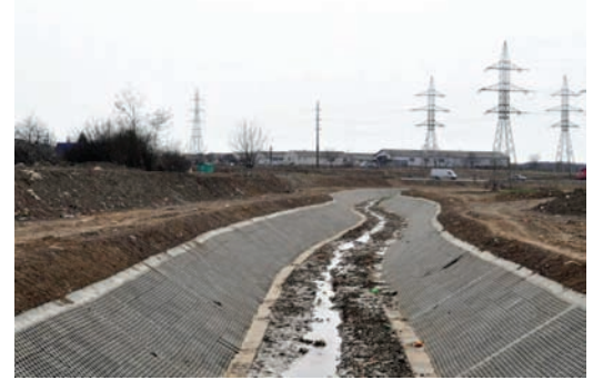
Valea Adona - Pereu dale tip fagure.

Investiția a presupus amenajarea albiei prin recalibrare pe lungimea 591 m, construcția canalului acoperit din beton pe lungimea de 668 m, consolidarea malurilor cu pereu din dale de beton pe lungimea de 1,37 km. Totodată a fost realizat zidul de