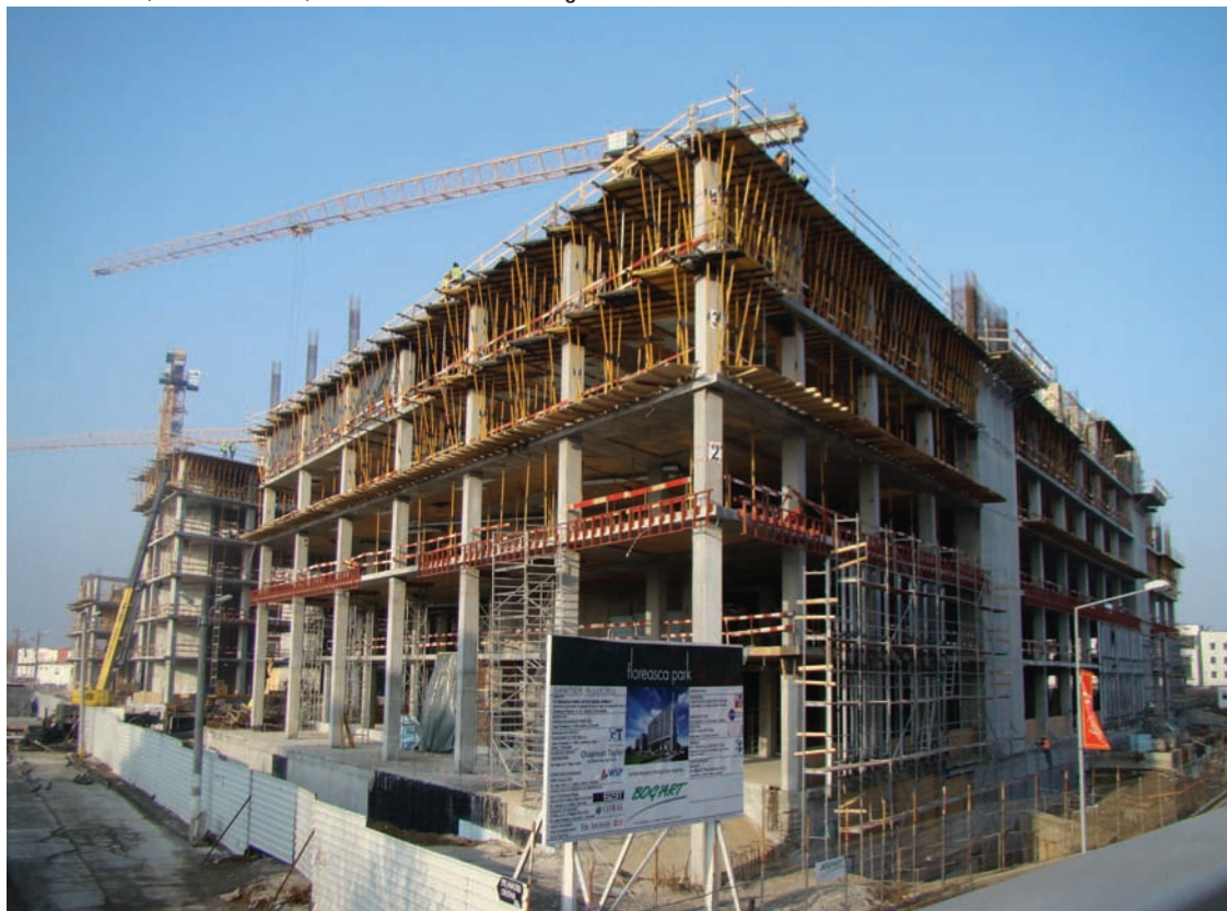
Floresca Park, februarie 2013, ansamblu construit de Bog’Art.

În ceea ce privește tehnologia, o primă provocare a fost construcția clădirii de birouri Porsche România. Aceasta s-a remarcat prin faptul că toate planșele au fost suspendate prin intermediu unor tiranți de partea superioară a clădirii. Charles de Gaulle Plaza a reprezentat o altă provocare – prima clădire din România executată în sistem „top down” (n.r. infrastructura și suprastructura clădirii se construiesc în paralel). La Băneasa Shopping City termenul de realizare a fost foarte scurt și am reușit să finalizăm proiectul coordonând în perioada de vârf, într-un ritm extrem de solicitant, peste 700 de muncitori, relatează reprezentantul Bog’Art.