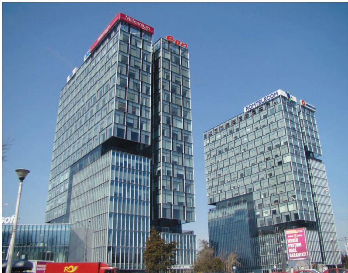
City Gate, construcții realizate de Bog'Art.