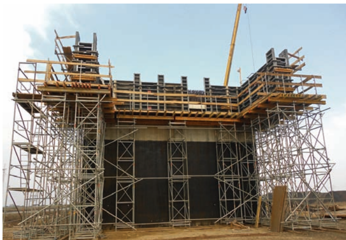
Exemplu de cofrare a zidurilor întoarse și a zidurilor de gardă