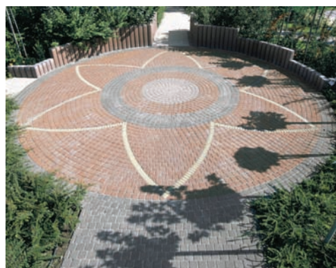
Piațeta publică: Pavaj clasic combinat, minipalisade masive și palisade

Utilizarea dalelor limitrofe de marcaj pentru nevăzători – un aspect important obligatoriu pentru orice construcție nouă sau reabilitare presupune utilizarea a două sisteme de la Semmelrock Stein + Design: dale cu caneluri sau dale cu noduri. Ambele sunt disponibile în format 40 x 40 cm și pot fi combinate foarte ușor cu orice altă opțiune de dale sau pavaje de la Semmelrock.