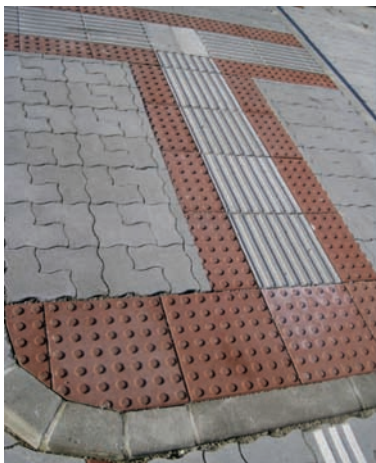
Scuar în intersecții: dale cu sant și dale cu noduri pentru nevăzători

Utilizarea dalelor limitrofe de marcaj pentru nevăzători – un aspect important obligatoriu pentru orice construcție nouă sau reabilitare presupune utilizarea a două sisteme de la Semmelrock Stein + Design: dale cu caneluri sau dale cu noduri. Ambele sunt disponibile în format 40 x 40 cm și pot fi combinate foarte ușor cu orice altă opțiune de dale sau pavaje de la Semmelrock.