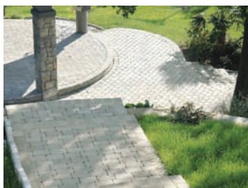
Scuar în grădină publică: Castelletto antichizat

► pavaj Appia Antica antichizat 20 x 20 cm și 20 x 10 cm, în special pentru zonele verzi din centrele istorice sau chiar civice, se prezintă cu suprafața naturală, nuanțată cu adaos de nisip cuarțos. Datorită faptului că evidențiază patina timpului, prezintă margini prelucrate neregulat și are o durabilitate remarcabilă.