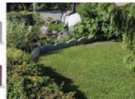
Rond de vegetație delimitat: Arcade 3 – gri și maro