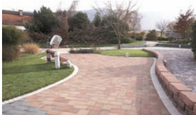
Alee pietonală: Rettango brun-roșcat

► pavaj Rettango 30 x 20 cm, 20 x 20 cm, 20 x 10 cm, cu suprafața de beton aparent, foarte rezistent la uzură, frecare, îngheț și sare de degivrare. Se remarcă prin fiabilitate și prin adaptarea la orice tip de spațiu exterior. Prezintă o cromatică foarte variată, de la gri neutru la combinații retro de tip cappuccino sau mediteran și este ușor de încadrat în orice ansamblu decorativ, de la scuaruri în grădini publice până la alei cu trafic pietonal nou construite.