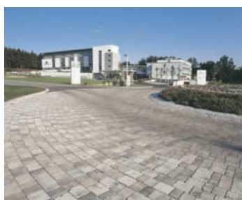
Scuar zonă centru civic: Appia Antica antichizat

► pavaj Appia Antica antichizat 20 x 20 cm și 20 x 10 cm, în special pentru zonele verzi din centrele istorice sau chiar civice, se prezintă cu suprafața naturală, nuanțată cu adaos de nisip cuarțos. Datorită faptului că evidențiază patina timpului, prezintă margini prelucrate neregulat și are o durabilitate remarcabilă.