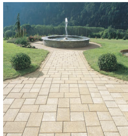
Scuar grădină publică: Pavaj Pastella

► pavaj Pastella 30 x 20 cm, 20 x 20 cm, 20 x 10 cm, utilizate unitar sau combinat. Se prezintă ca suprafață spălată, din criblură de piatră naturală de înaltă calitate și nisip cuarțos. Se remarcă prin sistemul de îmbinare performant Einstein, astfel încât prezintă siguranță maximă împotriva deplasării sau înfundării pavelor. Se găsește în cromatica discretă, culori gri deschis, bej, teracotă, care pot fi utilizate individual sau combinat, astfel încât să poată fi în ton cu mobilierul exterior. Este un pavaj modern pentru spații exterioare noi sau reabilitate.