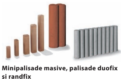
Minipalisade masive, palisade duofix și randfix

► Minipalisade masive , de delimitare a zonelor decorative din