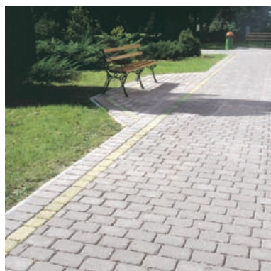
Alee parc: Castelletto antichizat

► pavaj Castelletto antichizat 12,5 cm gri sau bej, suficient de rezistent, astfel încât poate fi utilizat chiar și la zone cu trafic auto redus. Se prezintă sub forma de pietre cu suprafața antichizată, cu canturi sparte neregulat și poate fi un element de decor potrivit pentru alei din parcuri, grădini urbane sau scuaruri din grădini publice. Are rezistență mare la uzură și frecare, la raze UV, îngheț și sare de degivrare și montaj foarte ușor.