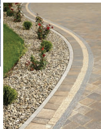
Alee parc: Appia Antica antichizat și bordură de delimitare alee

Borduri de delimitare a zonelor verzi de-a lungul aleilor sau scuarurilor