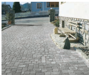
Grădină urbană: Castelletto antichizat