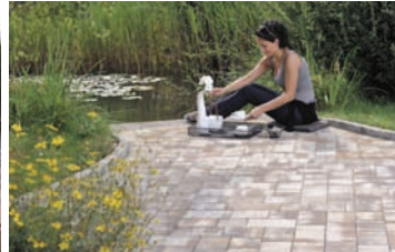
Scuar în grădină publică: Rettango cappuccino