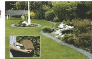
Bordură pentru delimitare gazon (gri, maro)

Borduri pentru delimitarea trotuarelor și aleilor de parc