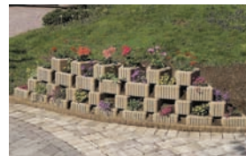
Elemente decorative pentru parcuri și grădini publice: Triflor

Utilizarea de elemente decorative în spațiile verzi urbane prezintă o gamă nou lansată de Semmelrock Stein + Design pentru amenajarea spațiilor verzi din parcuri, grădini publice, dar și zone verzi din jurul blocurilor și intersecțiilor.