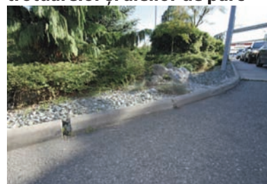
Alee parc: bordură de delimitare

Borduri pentru delimitarea trotuarelor și aleilor de parc