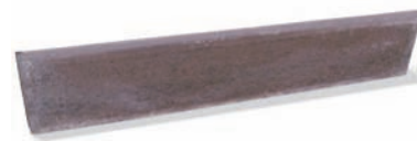
Bordură pentru parc (gri, roșu, bej, brun)

Borduri de delimitare a zonelor verzi de-a lungul aleilor sau scuarurilor