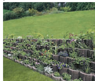
Elemente decorative pentru spații verzi în parcuri: Jardinieră de grădină (gri, maro)