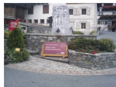
Scuar zonă centru istoric: Appia Antica antichizat