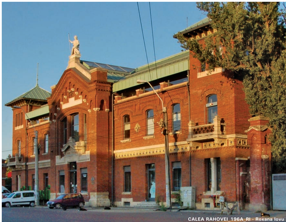
CALEA RAHOVEI_196A_RI - Roxana Iovu