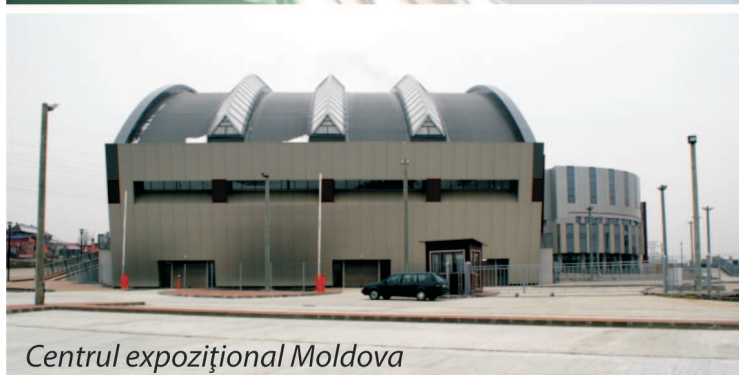
Centru expozițional Moldova