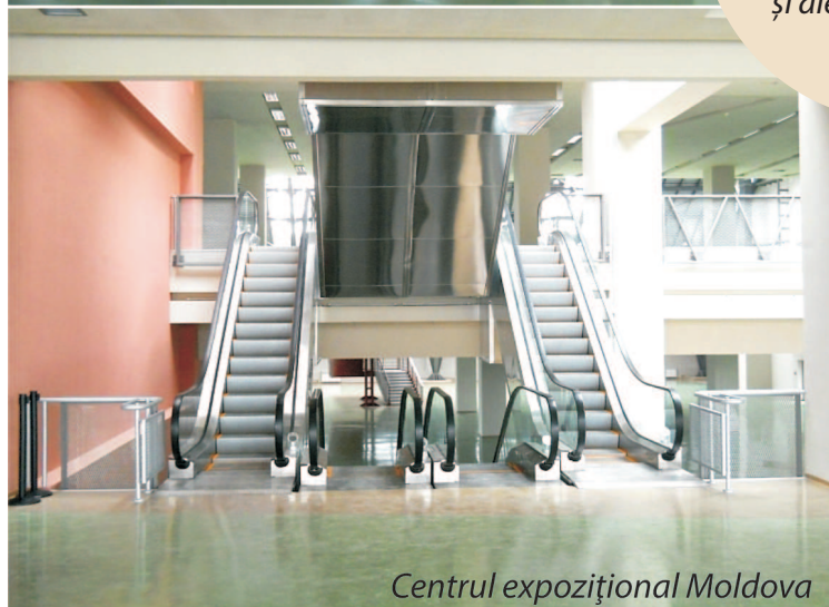
Centrul expozițional Moldova