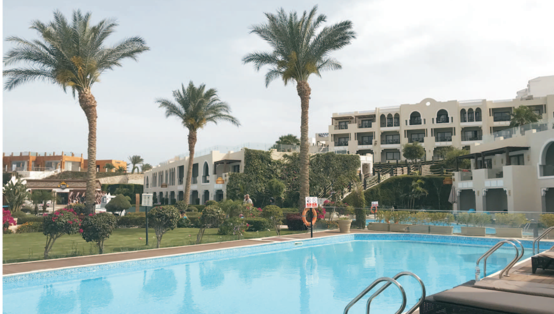
Sunrise Diamond Beach Resort