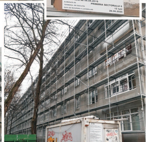
Fotografii de Dan Nicolaie