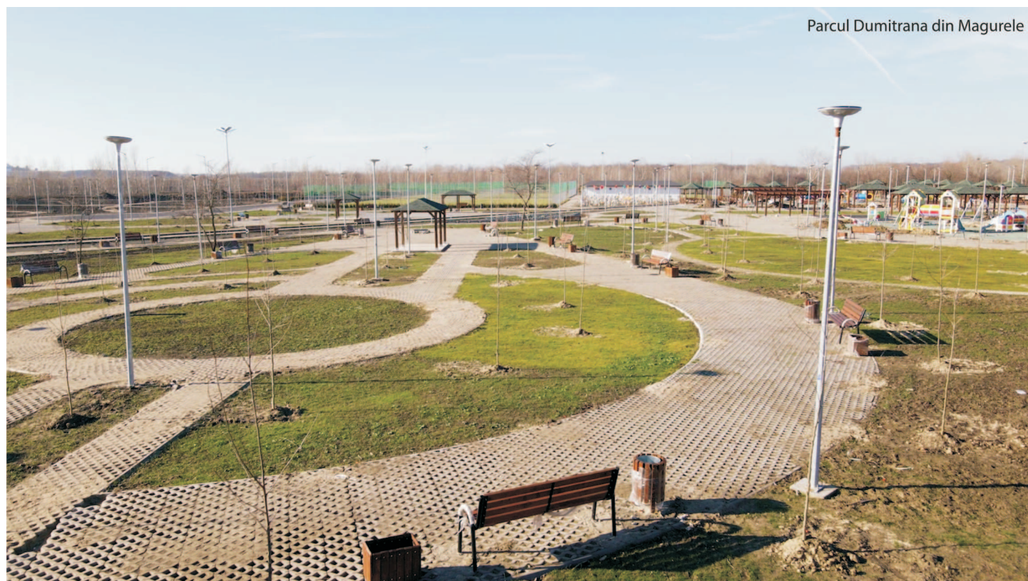
Parcul Dumitrana din Magurele

- Cetățeni inteligenți, adică implementarea de soluții digitale pentru stimularea capacității lo-