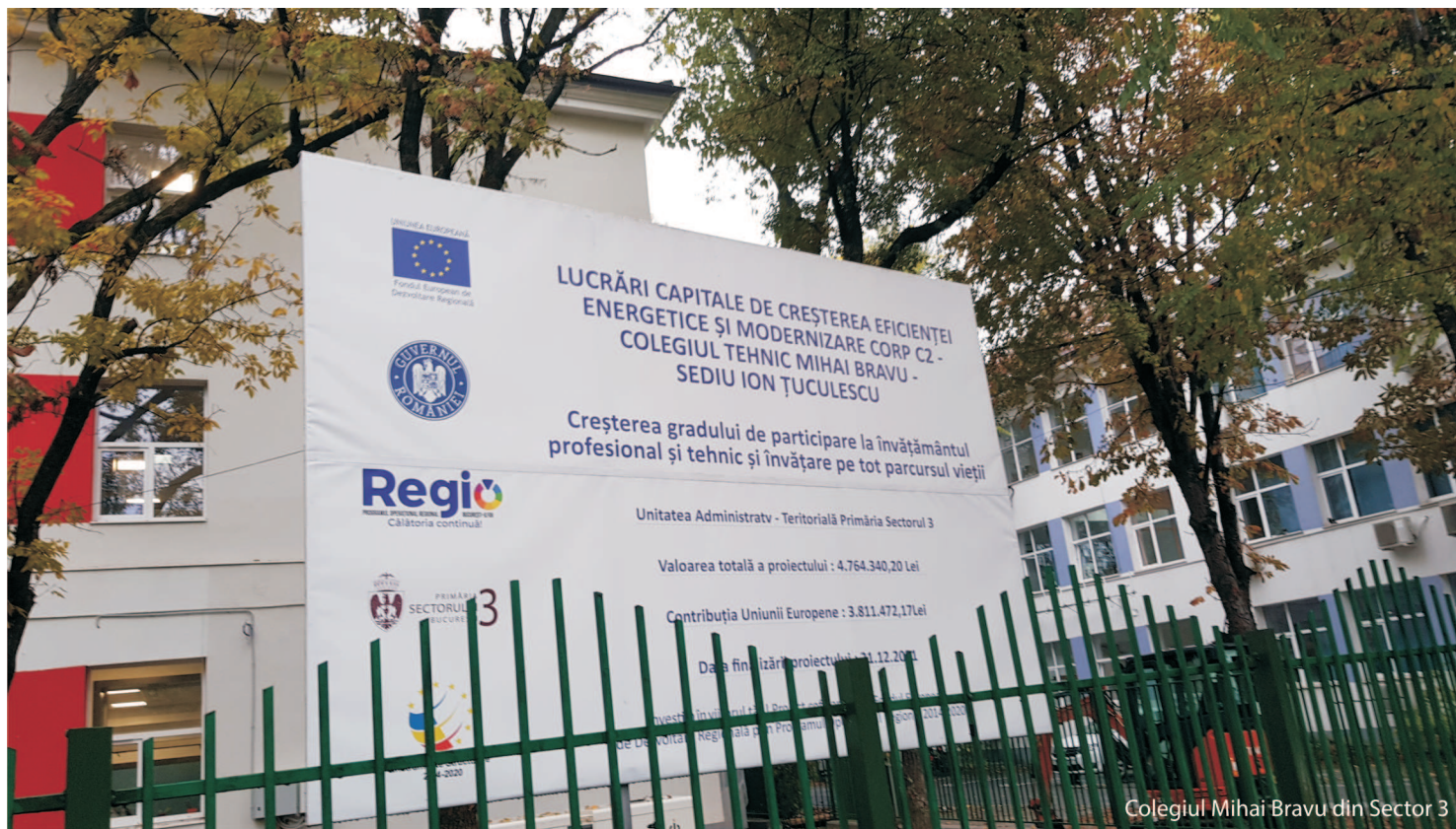
Colegiul Mihai Bravu din Sector 3

cuitorilor regiunii să fie pro-activi și să participe prin mijloace diverse la luarea deciziilor, îmbunătățirea nivelului lor de instruire digitală, platforme și aplicații de comunicare cu cetățenii, de implicare civică și voluntariat, de raportare de probleme etc.;