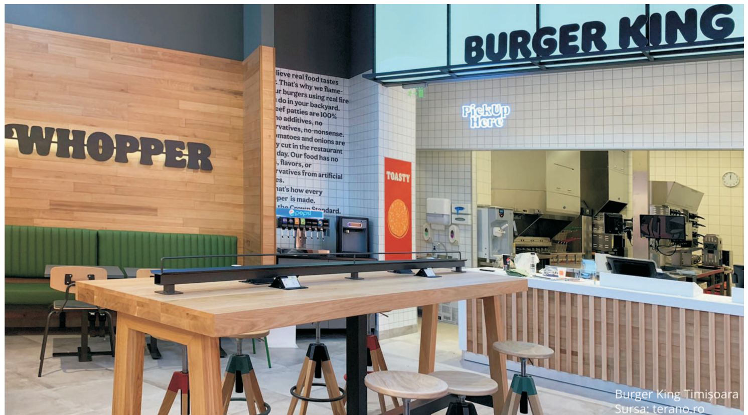
Burger King Timișoara