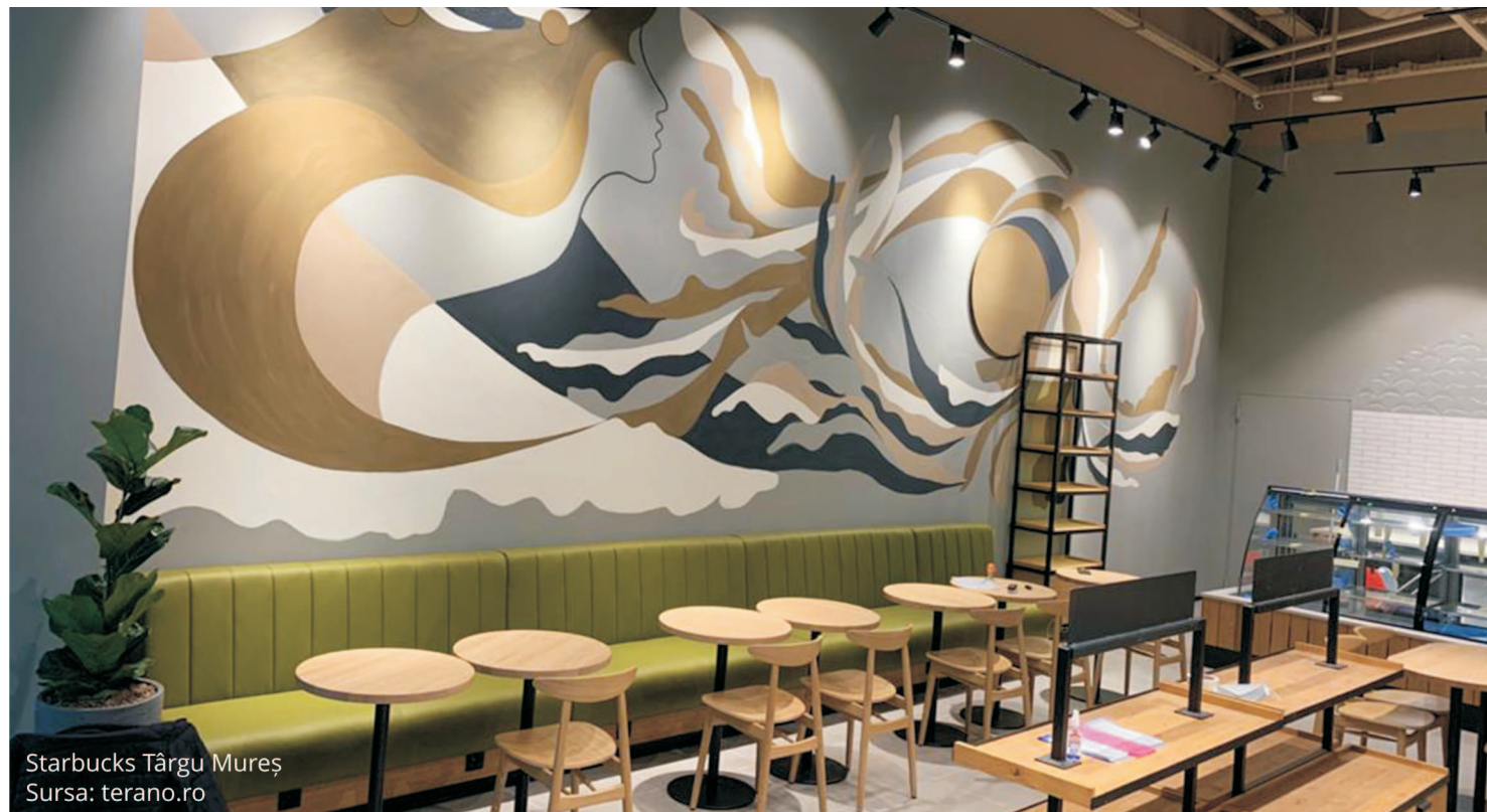
Starbucks Târgu Mureș